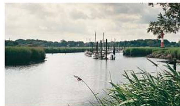
Wenn Sie uns auf dem Wasserweg erreichen wollen, können Sie im Yachthafen Berne-Juliusplate vor Anker gehen.