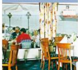
Tagesrestaurant mit Schiffsansage.

Schiffsansage für die in unmittelbarer Nähe vorbeifahrenden Seeschiffe aus aller Welt. Unsere Küche verwöhnt Sie mit einer qualitativ hochwertigen Regionalküche, mit Fischspezialitäten und Kuchen aus eigener Herstellung.