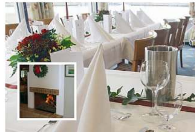
Tagesrestaurant mit Weserblick und Kamin.

Zwei Tagungsräume mit moderner Tagungstechnik für Tagungen/ Konferenzen von 8 bis 80 Personen stehen zur Verfügung. Mit unserem Service und Knowhow sorgen wir für einen reibungslosen Ablauf. Wir halten für Sie eine Anzahl von Menüvorschlägen und Tagungsarrangements zum Festpreis bereit, mit und ohne Übernachtung. Die Räume eignen sich ebenfalls für Hochzeiten und Familienfeiern. Runde Tische, Tanzfläche und eine kleine Bar runden das Ambiente ab. Auch hier halten wir Vorschläge bereit, Festpreise nach Absprache. Gern richten wir Veranstaltungen bis zu 100 Personen für Sie aus.