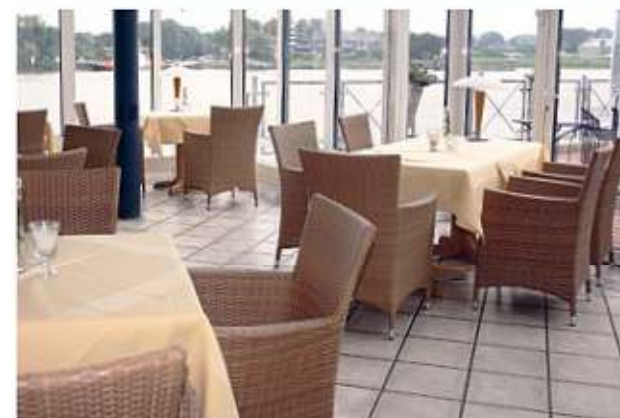
Im Wintergarten in der Morgensonne frühstücken mit einem herrlichen Blick auf die Weser.